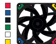
NF-A12x15 PWM chromax.black.swap